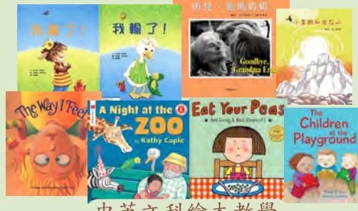
中英文科繪本教學